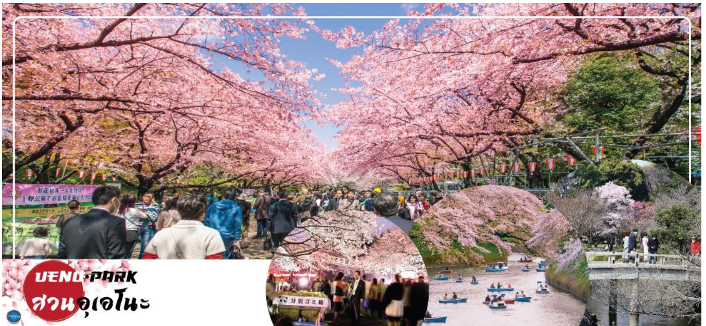
UENO PARK สวนอุเอโนะ

วันที่สี่ เมืองนาริตะ – กรุงโตเกียว – สวนอุเอโนะ (จุดชมซากุระขึ้นกับภูมิอากาศ) – ชมแมวยักษ์ 3 มิติ พร้อมช้อปปิ้ง ย่านชินจูกุ – เมืองนาริตะ – อีออน มอลล์ นาริตะ